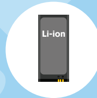
BATERÍAS DE REPUESTO